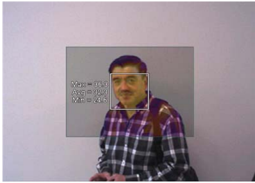
可见光显示被测人容貌，同时显示温度值