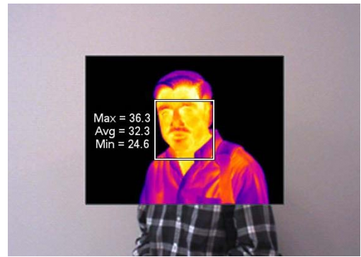
红外图像显示人体体表最高和最低温度